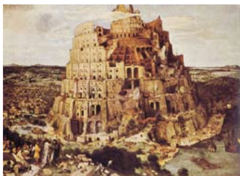
Pieter Brueghel: Babel tornya