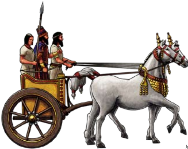
Korabeli harci szekér

A „sztyeppi hadviselés” elterjedése (Kr. e. 2. évezred közepe) megváltoztatta a korabeli ütközeteket. A hatékonyabb, 200-300 harci szekérből álló haderő könnyedén legyőzte a vele szemben gyalogosan harcoló alakulatokat. Az új hadviselés a fegyverzetben is megmutatkozott: a korábbi réz- és bronzeszközöket a vasból készült fegyver váltotta fel. A közelharc eszközei (kard, lándzsa, pajzs) mellett elterjedt a közel 100 m-es lőtávolsággal rendelkező íj. Az újfajta harcmodor egy új katonai réteg kialakulásához is vezetett, hiszen a lovak tenyésztése nagy költségekkel járt, ezért csak az arisztokrácia engedhette meg magának. A csatatereken megjelenő harci méneket (Kr. e. 1. évezred közepe) elsősorban a kiváltságos réteg alkalmazta.