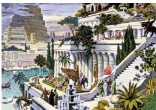
Szemirámisz függőkertjének rekonstrukciós rajza