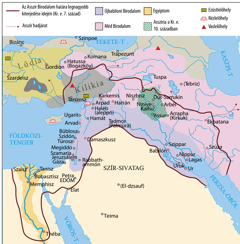
A hódító Asszír Birodalom

Összegezzük, hogy milyen térségek és kultúrák kerültek az asszírok fennhatósága alá! Hogyan befolyásolhatta az asszírok földrajzi elhelyezkedése a hódításokat? Milyen módon osztották fel az Asszír Birodalmat a médek és az újbabiloniak? Melyik mai ország területén találhatóak a birodalmak központjai?