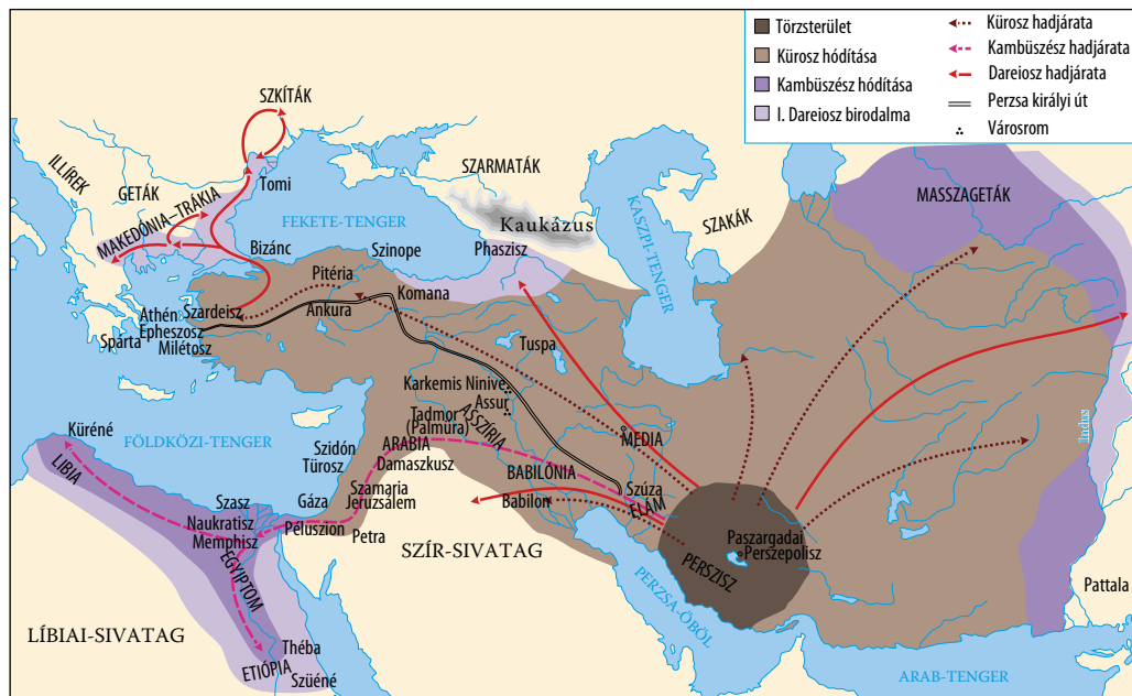
A Perzsa Birodalom I. Dareiosz korában

A perzsák módszerei különböztek az eddigi hódítóktól: meghagyták a régi hagyományokat, törvényeket, és nem erőltették a perzsa szokások átvételét. A perzsák vallása szerint két főistenség, két ellentétes erő létezik (a Jó és a Gonosz). Mindkettő harcot folytat a világ uralmáért, s az emberek szabadon dönthetnek, hogy melyiket szolgálják ( vallási dualizmus ). A jó cselekedetek jutalma a halál után az örök boldogság lesz, a gonosz cselekedeteké pedig az örök szenvedés.