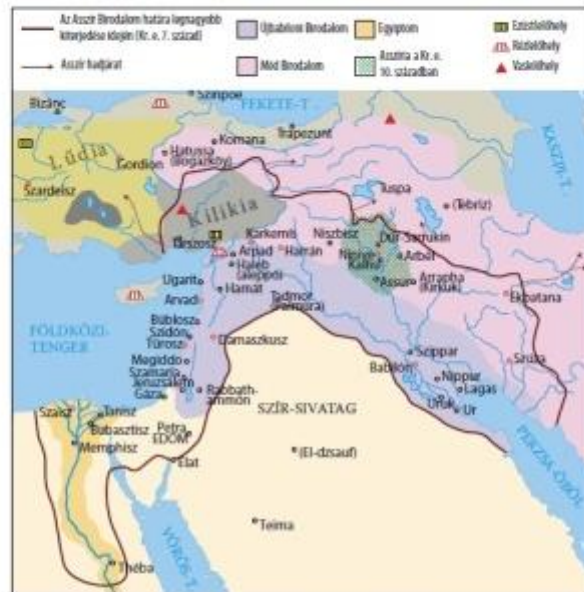
A hódító Asszír Birodalom

Osszegezzük, hogy milyen térségek és kultúrák kerültek az asszírok fennhatósága alá! Hogyan befolyásolhatta az asszírok földrajzi elhelyezkedése a hódításokat? Milyen módon osztották fel az Asszír Birodalmat a médek és az újbabiloniak? Melyik mai ország területén találhatóak a birodalmak központjai?