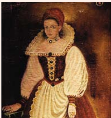
Báthory Erzsébet portréja

A büszke Csejthe várának Hatalmas asszonya Nehézkes álmokat lát Ha megjön alkonya.