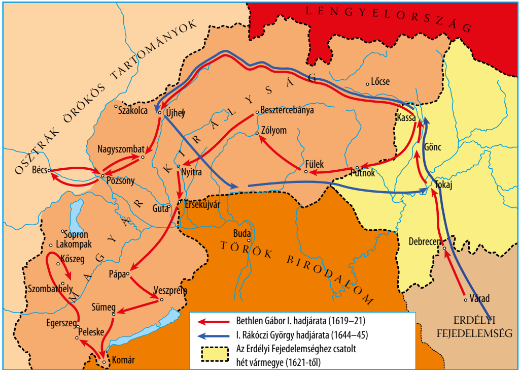
Erdélyi hadjáratok a Habsburgok ellen

Idézzük fel a harmincéves háború főbb hadmozdulatait a tankönyv 235. oldalán lévő térkép segítségével! Illesszük be az erdélyi hadjáratokat a háború eseménytörténetébe! Mennyire voltak sikeresek az említett hadmozdulatok?