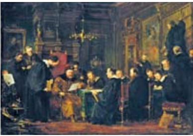
Dósa Géza: Bethlen Gábor tudósai körében

A fejedelemség virágzása utóda, I. Rákóczi György (1630–1648) alatt folytatódott, aki Erdély bel- és külpolitikáján nem változtatott. A fejedelemség a korszakban a protestantizmus élharcosai közé tartozott, újból beavatkozott az európai háborúba (1644–45). I. Rákóczi György hadjáratával elérte, hogy a Habsburgok végül szabad vallásgyakorlatot biztosítottak minden társadalmi réteg számára a királyi Magyarország területén (linzi béke, 1645). A harcok során a fejedelemség, Bocskaihoz hűen, megvédte a magyar rendi jogokat a Habsburg-abszolutizmussal szemben. Így nem meglepő, hogy a harmincéves háborút lezáró béketárgyalásokon (1648) az európai hatalmak Erdélyre közp-hatalomként tekintettek.