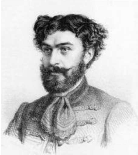
7. kép: Thaly Kálmán (1839–1909)

különösen annak leglényegesebb részei: „nem ... megalázó”, „a hősök tusája nem maradt meddő” szinte parafrázisa Thaly, illetve Acsády véleményének, s egyben bizonyítéka annak is, hogy a századforduló tankönyvei már hű tükörképét mutatják a korabeli tudománynak.