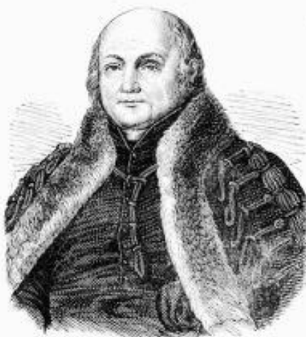
2. kép: Budai Ézsaiás (1766–1841)

„ Gonosz megjegyzés, de talán nem teljesen alap nélküli, hogy ezért is részesült I. Ferenc királytól 1800-ban aranyérem kitüntetésben. A katolikus történetírókra azonban mindig is jellemzőbb volt a Habsburgok iránti