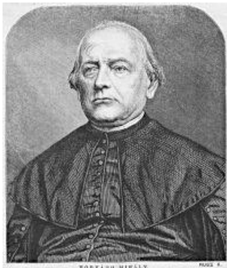
5. kép: Horváth Mihály (1809–1878), a „demokrácia történetírója”

Immár a katolikus történetírók tankönyvei sem egyértelműen Habsburg-pártiak, bár kétségkívül „visszafogottabbak”, időnként saját egyházuk múltját illetően is. A piarista Spányik Glycér például tankönyvében (TANKÖNYVTÁR 3.) 20 , melyben a szabadságharc előzményeinek ismertetése bizonyos megértést, sőt burkolt rokonszenvet árul el Rákóczi és hívei iránt. A következőket sorolja fel: A törökkel kötött béke megtárgyalására egy magyart sem hívtak meg; a Habsburg-ház örökösödési jogának megállapítása, az ellenállási jog eltörlése, a papi és világi hivatalok idegenekkel való betöltése, az állandó adózás bevezetése, a külföldi katonaságnak az országban való állomásoztatása; hogy “a Protestánsoktól újra sok templom elvétel, s a Protestánsok által lakott városokban a Jezsuitáknak Collegiumok és Gymnasiumok építettek, s más több efélék a nemzet