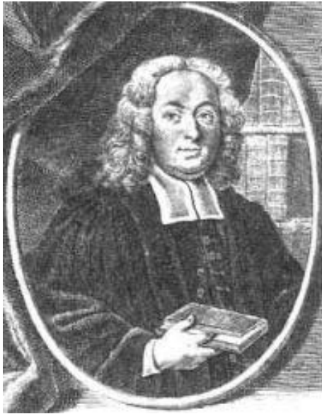
1. kép: Béla Mátyás (1684–1749)

Ami a Rákóczi-szabadságharc XVIII. századi történetírói feldolgozását illeti, azokat meghatározta, hogy nem a kor békekötési normái szerint fejeződött be az összecsapás. Egyrészt a Habsburg kormányzat elvárásai csak részben érvényesültek, másrészt I. József császár váratlan halálát eltitkolva hozták a megállapodást tető alá. „A század folyamán két szemlélet, a folyamatosság és felvilágosodás tengelyén alakultak ki az első történeti összefoglalások. A század első felében általában a folyamatosság, mint legfőbb érték kategória érvényesül ...”, míg, „A század utolsó évtizedeiben már nyilvánvaló, hogy olyan alapvető kérdések várnak megoldásra, amelyeket a Rákóczi-szabadságharc idején már elrendeztek, mint a vallási tolerancia, a nemesség közteher-vállalási kötelezettsége, a közhatalmi jobbjogvédelem, Erdély és az országegység, a kulturális önrendelkezés és a magyar nyelv kultúrája.” 3