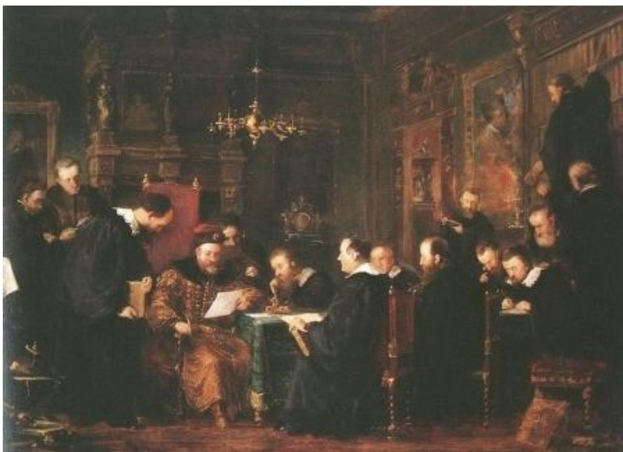
4. kép: Bethlen Gábor tudósai között. Dósa Géza festménye, 1870. Magyar Nemzeti Galéria