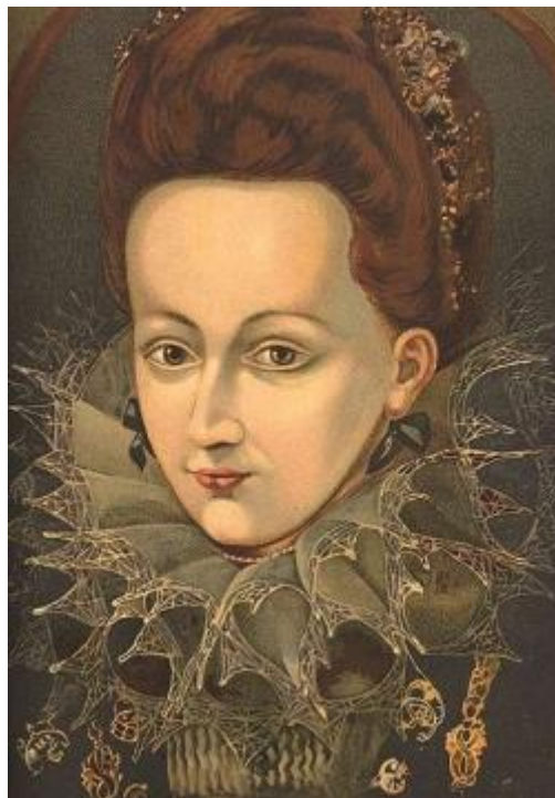
2. kép: Brandenburgi Katalin (1604–1649)