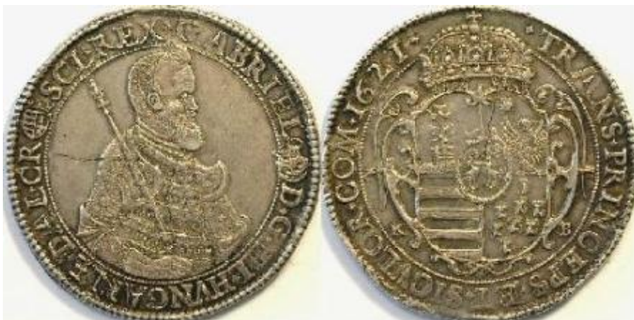
3. kép: Bethlen Gábor tallér 1621-ből