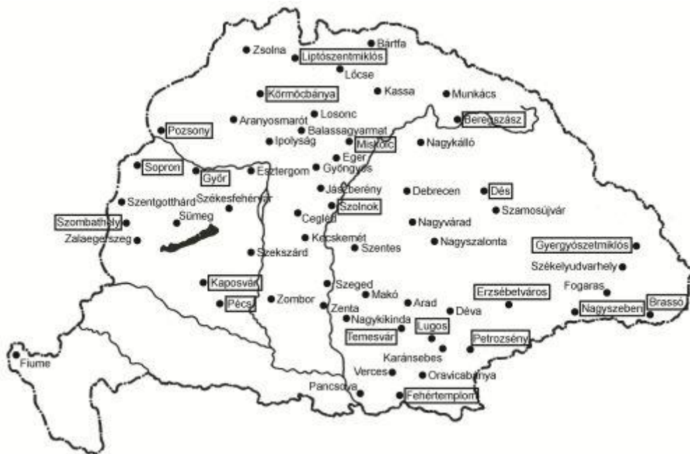
2. térkép: Mika Sándor Világtörténet című tankönyveit választó állami (vagy városi) fiú középiskolák az 1910-es években (a térkép csak a földrajzi helység nevét jelöli) (Készítette: Vörös Péter)

Mi lehetett a Mika-Marczinkó -féle sorozat sikerének a titka? Mika Sándor tankönyve (és a húzónév minden kétséget kizáróan Mika lehetett) több évtizede volt forgalomban, a hosszú ideig forgalomban lévő tankönyvektől pedig – tudjuk – nem szívesen váltak (ma sem válnak) meg az oktatók. A Mika -féle tankönyv sikerének titka – a szerző szakmai kvalitása mellett – tehát egyrészt a könyv bejáratottsága lehetett. Ezt támasztják alá Szigethy Lajos 1931. május 25-i keltezésű bírálati jelentésének alábbi sorai is: "a könyvet nemcsak az állami engedélyezés, hanem sok évnek próbája is támogatja a bíráló előtt." 19