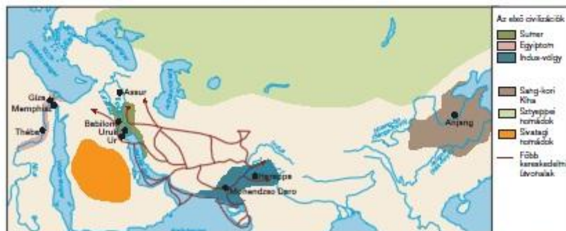
● Milyen közös vonások fedezhetők fel az első civilizációk között? a) Milyen területek terjedtek ki? b) Milyen jellegű települések jöttek létre? ● Földrajzi atlaszában is keresse meg és tanulmányozza a nomádok vándorlási területeit! Mi a különbség a kétféle nomád környezet között? ● Hogyan befolyásolta a földrajzi környezet az egyes civilizációkat kialakító népek sorsát? ● Mit gondol, mi bizonyíthatja a civilizációk közötti kapcsolatokat ebben a korban?