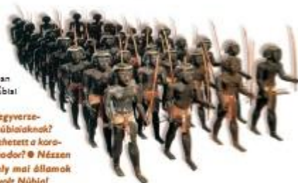
Ez volt a szelid núbiai zsoldosok

A földművelő civilizációk és a nomádok viszonya nagyon változatos volt. Gyakran együttműködtek, kicserélték termékeiket, előfordult, hogy „beszivárogtak” egymás területeire, munkásként vagy zsoldosként szolgáltak, de gyakran az is megesett, hogy megpróbálták leigázni egymást.