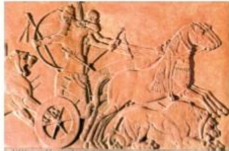
Asszír harci szakár, Kr. e. 8–7. század ● Hasonlítsa össze a két harci szakár ábrázolását! ● Milyen különbségek olvashatók le a képekről? ● Mi lehetett a változások jelentősége?