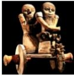
Mezopotámiai harci szakár, Kr. e. II. évszázad

Babilontól északra terült el fő vetélytársa, Asszír. Az asszírok többször meghódították és lerombolták Babilont, de az mindig újjáépült, s végül túlélte az asszír állam bukását.