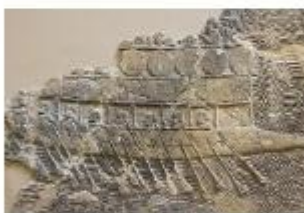
A föníciai hajók elérték a Brit-szigetek partjait és Nyugat-Afrikát, sőt állítólag megkerülték Afrikát is. A tengeri kereskedelemben azonban egyre komolyabb vetéléstársat jelentettek számukra a cőrések.

● Honnan tudhatjuk, mikor készült a jelentés? ● Mit mondtak a núbiaiak a sivatagról? ● Vajon miért jöttek Egyiptomba? ● Vajon miért küldték őket vissza a sivatagba?