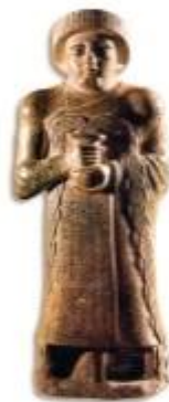
Gudea, a sumer Lagas város uralkodójának szobra Kr. e. 2100 körül készült. A király kezében tartott edényből folyók erednek. A kéző tavasszal, kora nyáron érkező áradásokat mással kellett távol tartani a bevetett földektől, majd a forró nyár folyamán csatornák, tárolók és vízemelők segítségével a földekre kellett juttatni a vizet. ● Mit jelképeznek a király kezéből eredő folyók? ● Mi az üzenete a szobornak? Adjon címet nek!

AZ ÓKORI KELET Kr. e. 7000 és 3000 között a világ számos részén megkezdődött a mezőgazdasági termelés – így Közép- és Dél-Amerikában, Nyugat-Afrikában, Európában, Új-Guineán. Az első földművesek ott számíthatnak a legnagyobb termésre, ahol a nagy folyók áradásos területein öntözéses növénytermesztést alakítottak ki a Nílus, az Eufrátesz és a Tigris, az Indus és a kínai Sárga-folyó völgyében. Itt, az ún. ókori Kelet területén alakultak ki Kr. e. 3500 és 2000 között az első civilizációk: lakóik városokat építettek, írásbeliséget, fejlett tárgyi és szellemi kultúrát alakítottak ki, és létrehozták az első államokat.