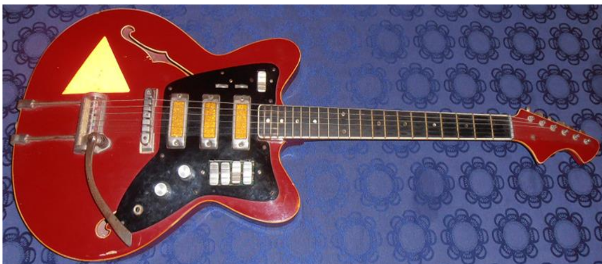
1. kép: Saját gitár (Saját felvétel és gitár)

A gimnáziumi kerettanterv korszakra vonatkozó követelményei között szerepel a „három T” fogalma. Ugyanakkor a középszintű érettségi követelményei között elvárás a rendszer jellemzőinek ismerete a Kádár-korszakban, és a korszak életmódjának és a mindennapjainak ismerete is. A téma tanításához jónak tartom a könnyűzenei példákön keresztül történő megközelítést, hiszen tanítványaink mindegyike hallgat zenét, vannak kedvenceik. Számukra természetes, hogy bármely ország bármely előadójának bármilyen szövegű zenéjéhez hozzá tudnak jutni. Így annak megtapasztalása, hogy ez nem mindig volt így, kellőképpen kizökkenti őket mindennapjaikból, ennek segítségével könnyű felkelteni az érdeklődésüket. Számomra mindig kellemes meglepetés, amikor az óra során kiderül, hogy a dalok egy része diákjaim számára is ismerős. Általában azt mondják el, hogy ezeket a dalokat otthon, szüleik zenehallgatásának „melléktermékeként” ismerték meg. Volt, aki úgy fogalmazott, hogy ezeken nőtt fel.