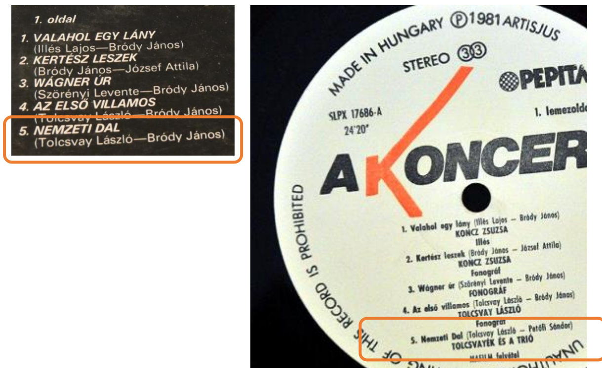
4. kép: A Nemzeti dal a Koncert-lemez borítójának részletén és az első lemezoldali körcímkén 4

A Tolcsvay László által készített Nemzeti dal esetében a hallgatása során az „A magyarok istenére esküszünk, esküszünk, hogy rabok tovább nem leszünk” szövegrész is meg szokta hozni a felismerést.