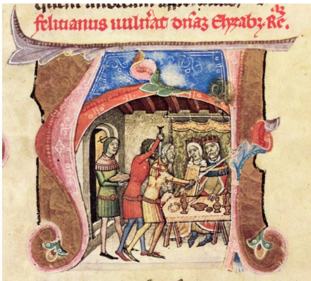
1. kép: A merénylet ábrázolása a Képes krónikában